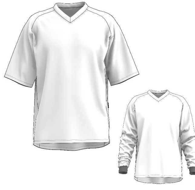
OSKAR_V2 mc et ml

Coupe regular – Bi-matières : Maille embossée résistante à l'abrasion sur le devant et manches + Maille aérée FullDry® au dos - Manches raglans - Col rond.