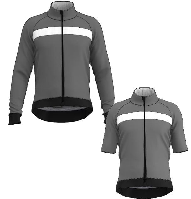
RYKERml_V3 + RYKERmc_V3

Coupe très ajustée - Veste thermique en Waterstop® extensible – Arrière des manches et côtés en ThermoXTENS embossé - 3 poches dos toutes tailles avec transferts Reflex et 4 ème poche zippée à l'intérieur – Poignets Clean-Cut - Zip intégral YKK autobloquant étanche - Col montant - Antiglisse silicone et liquette au dos avec biais Reflex - Isotype Poli sur vignette LENTEX®.