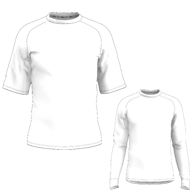
LOGAN mc et ml