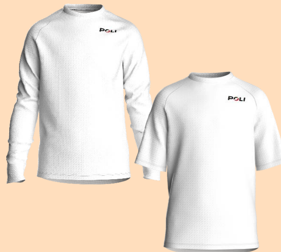
LOGYmc et ml

Coupe regular – Jacquard gratté 100% polyester – 2 poches dos pour 6A et 8A, 3 poches dos pour 10A, 12A et 14A – Ourlet bas avec élastique – Bas de manches avec ourlet simple - Petit col - Zip intégral autobloquant.